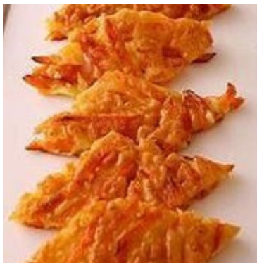
家呑みトモごはん