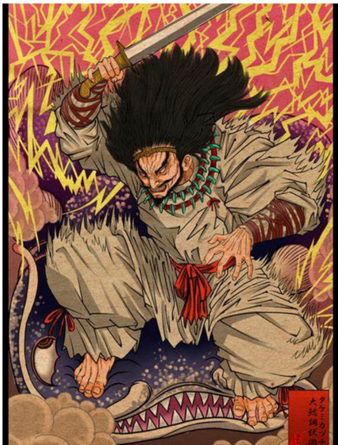
コトタマ幸座 公式ライン