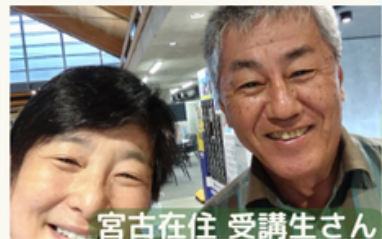
宮古在住 受講生さん