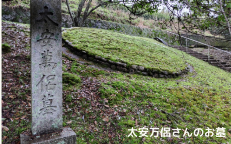
太安万侶さんのお墓